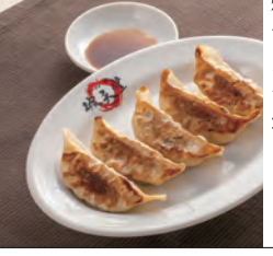
30 ラーメン一筋 破天堂

焼き上がりに約7分かかりますのでご注文の時はお気を付けてください! ぜひビールのおつまみにどうぞ!! 焼きギョーザ (にんにくギョーザ) (1皿・5コ入) 300円