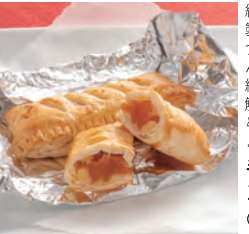
25 お菓子処 丸美屋

紅玉を使用した自家製コンポートが絶品です。アルミホイルで包んで冷凍してあります。網の端の方でゆっくり解凍しながら、あたためてください。こげないように気をつけて。 手づくりアップルパイ (1コ) 250円