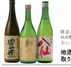
28 八食酒屋 地酒本舗

チーズケーキ、プレーン・りんご・抹茶味の3コ入 自然解凍25分程で美味しく召し上がれますので、食後のデザートに、ご堪能ください。 朝の八甲田 3種アソート (3コ) 842円